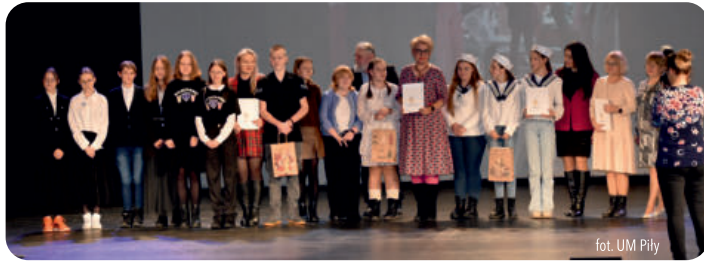
fol. UM Piły

z powyższych 63 wskaźników cząstkowych. To wskaźniki, które wpisują się w wypracowaną w Instytucie koncepcję 6 Obszarów Funkcjonowania Rodziny, przy pomocy których gmina może wpływać na satysfakcję rodzin.” - czytamy między innymi na stronie Serwisu Samorządowego PAP.