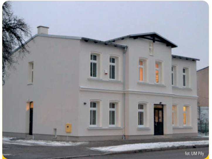
fol. UM Piły

Wszystkim wolontariuszom za bezinteresowność, pracę na rzecz innych, poświęcenie i siłę - w imieniu mieszkańców Piły, podziękowała zastępca prezydenta Piły Beata Dudzińska.